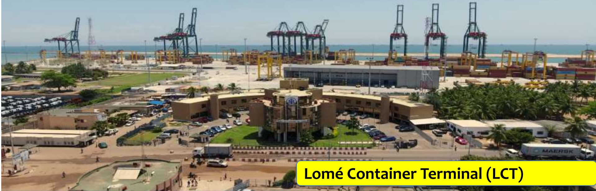
Lomé Container Terminal (LCT)