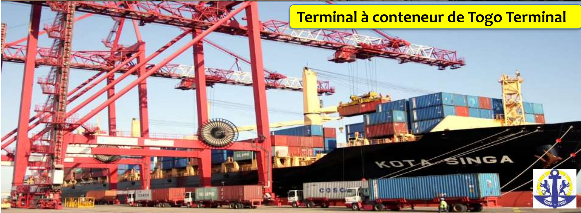
Terminal à conteneur de Togo Terminal