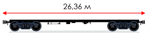
80-футовая фитинговая платформа