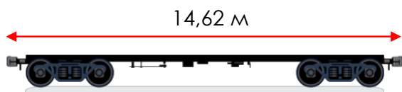
40-футовая фитинговая платформа