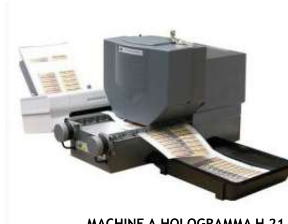
MACHINE A HOLOGRAMMA H 21