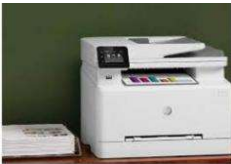
IMPRIMANTE CANON A4 COULEUR