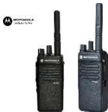
RADIO TALKY WALKY MOTOROLA