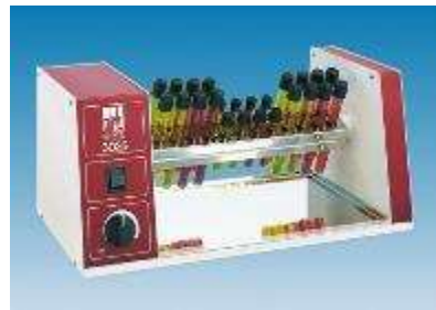
AGITATEUR ROTATIF TUBE