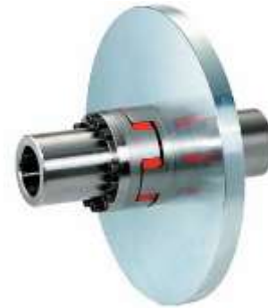
FREIN A DISQUE