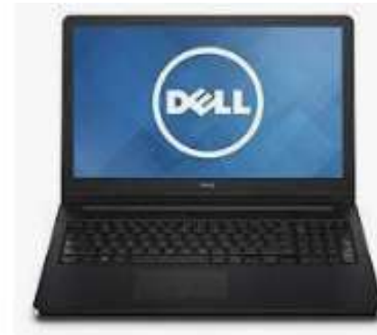
LAPTOP DE MARQUE DELL