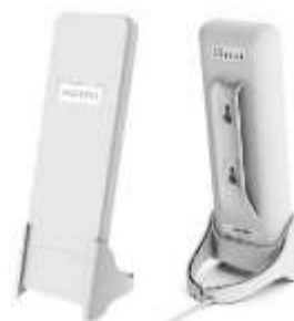
WIFI ALTAÏ C1N