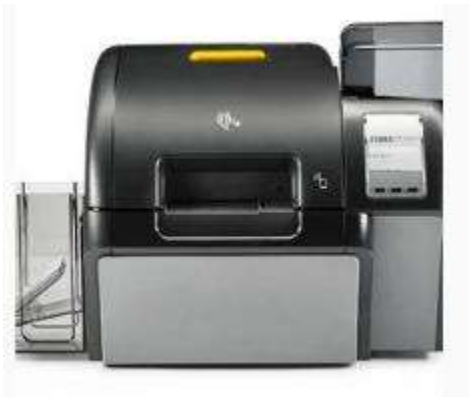
IMPRIMANTE ZEBRA Z XP SERIE9