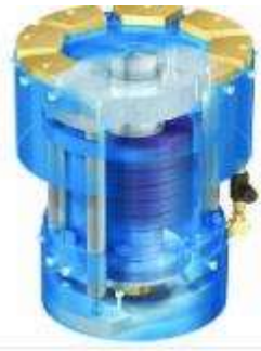
POUSSOIR DE RAIL