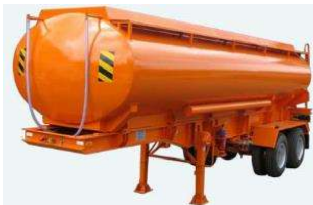
CITERNE A CARBURANT