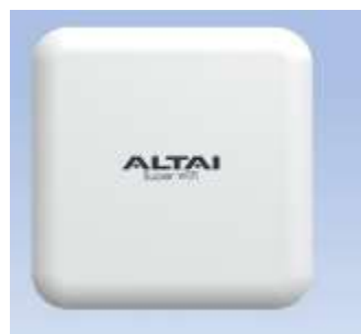
WIFI ALTAÏ 1X500