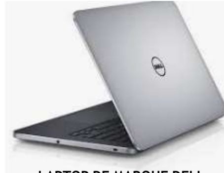
LAPTOP DE MARQUE DELL