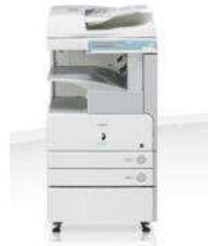
COPIEUR CANON A3