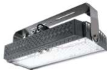
COMMANDER FLOOD Série pour les STS et RTG