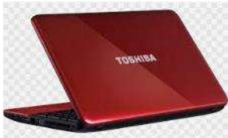
LAPTOP DE MARQUE TOSHIBA