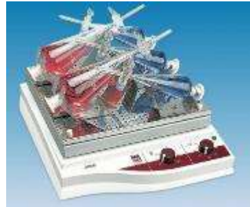
AGITATEUR SECOUS VA-ET-VIENT