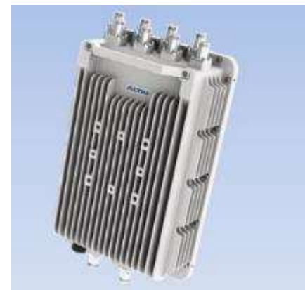
Wifi ALTAÏ A8