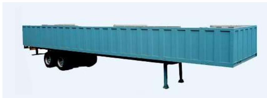
REMORQUE GROUPEE POUR CONTENEURS