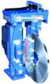
FREIN A DISQUE