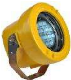
DLX LED Docklite pour les endroits dangereux, anti-explosions