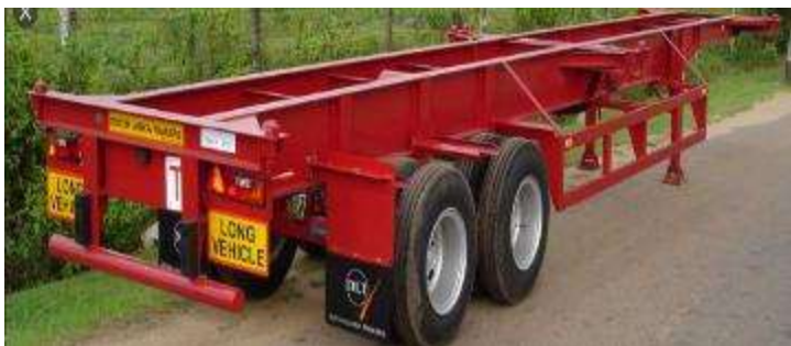
REMORQUE SQUELETIQUE POUR TERMINAUX