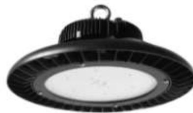
ASCEND Série pour ateliers et magasins