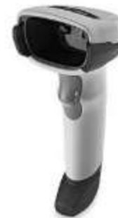
IMAGE PORTABLE ID/2D DS2200