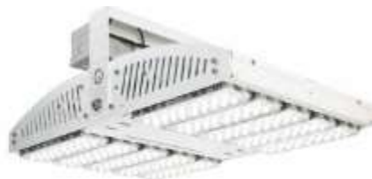
HIGHLAND Série pour éclairage des mâts