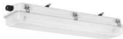
READILED Série pour éclairage linéaire