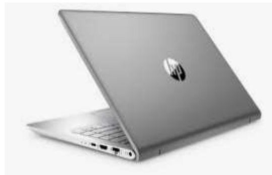
LAPTOP DE MARQUE HP