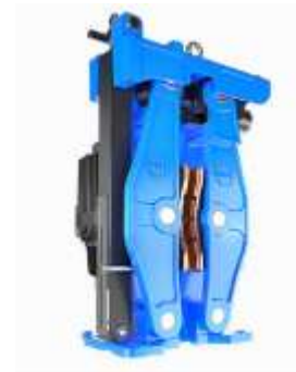
FREIN DE SERVICE USB