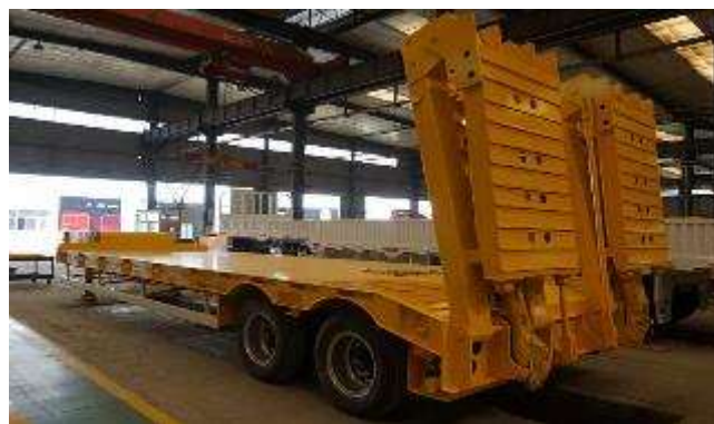
REMORQUE POUR TRANSPORT DES ÉQUIPEMENT MOBILES