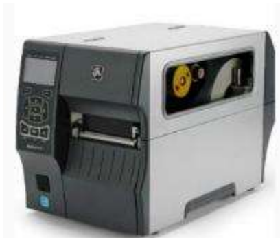
IMPRIMANTE INSUSTRIELLE ZT 400 SERIES