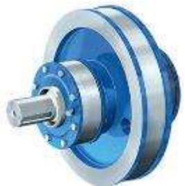
FREIN POUR ROUE DE GRUE