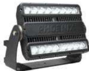
MODCOM 2 Série pour STS et RTG