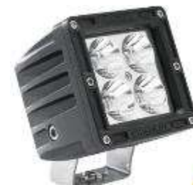
E15 pour équipements mobiles