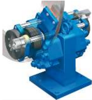
FREIN D'ARRÊT D'URGENCE